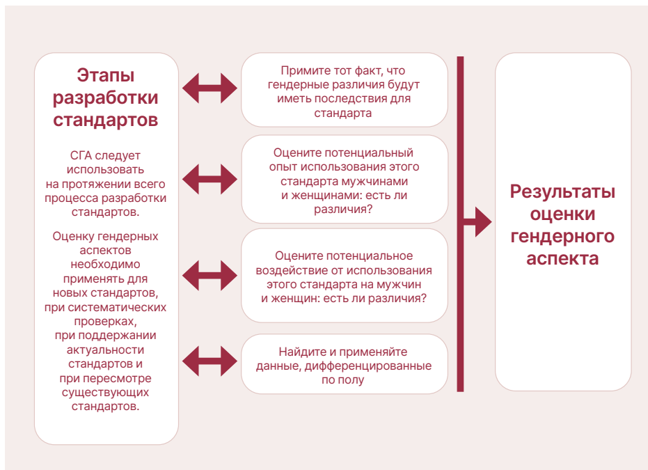
Рисунок 1. Процесс оценки учета гендерных аспектов в стандартах

На рисунке 1 далее представлен процесс оценки учета гендерных аспектов, который подробно описан в Форме оценки СГА.